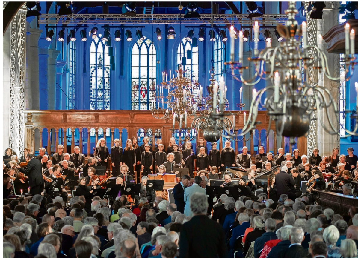
Bezoekers op weg naar hun plaats voorafgaand aan de Matthäus Passion van 2019.